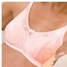
Modèle Alexis # 77120