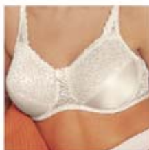
Modèle Tia #7758