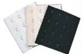
Rallonges de soutiens-gorge