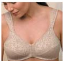
Modèle Diamond # 77128

Pour relaxer en tout confort tous les jours.