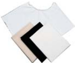
Pochettes pour prothèses mammaires