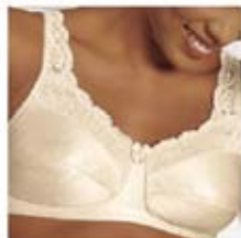
Modèle Annabell # 16699

Bonnets souples. Modèles variés avec différentes options de fermeture, à coutures verticales, avec armature et/ou en dentelle.