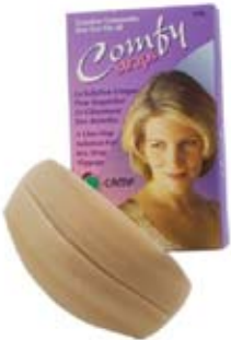
Bretelles Comfy pour soulager les épaules