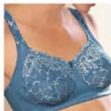
Modèle Carmen #77127

Bonnets souples ou amples. Modèles variés, avec ou sans armature, en dentelle ou type camisole.