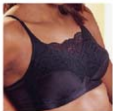
Modèle Isabel # 16867

Pour mettre son style personnel en valeur. Reflète les plus récentes tendances.