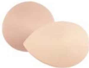
Coquilles en nylon pour compléter la forme du sein