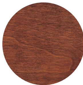
16 | BRUN MOYEN — CHESTNUT