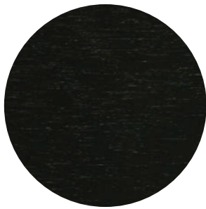
79 | ESPRESSO