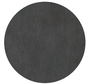
86 | GRIS CHARBON — CHARCOAL GREY