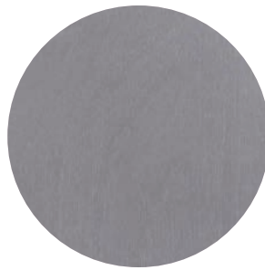
85 | GRIS — GREY