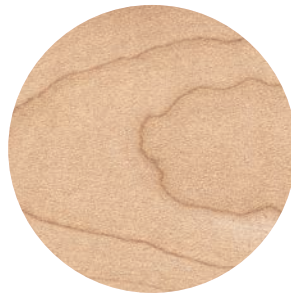
03 | NATUREL — NATURAL