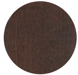
06 | CAFÉ MAT — MATTE COFFEE