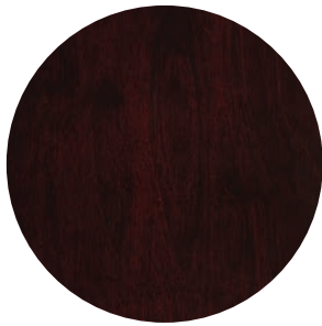
01 | CERISIER — CHERRY

SÉLECTIONNEZ VOTRE FINI DE BOIS CHOOSE YOUR WOOD FINISH