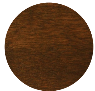
18 | MOISSON — HARVEST