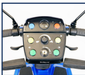
Panneau de contrôle