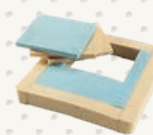
COUSSIN PRÉ-CURE® PRO