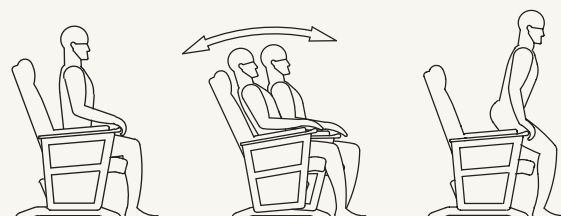
Fixe lors de l'assise

Le système est facile, silencieux et bloque à n'importe quelle position. Selon le modèle, les possibilités d'ajustements et d'accessoires permettent d'adapter le Thera-Glide® en fonction de vos besoins spécifiques. Il est d'entretien facile grâce aux recouvrements amovibles et aux matériaux utilisés.