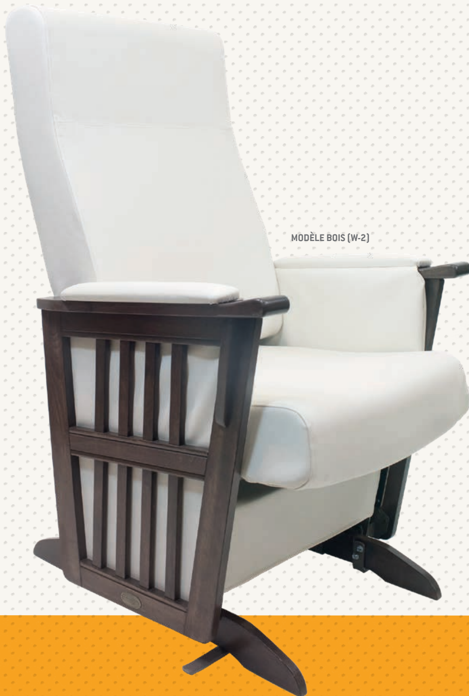
MODÈLE BOIS (W-2)